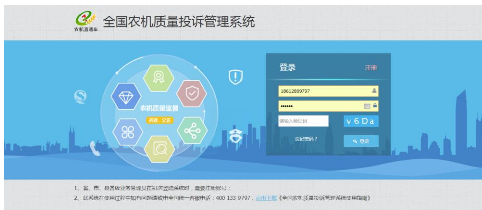
(图 1) 登录/注册界面

2) 注册登录账号：打开《中国农业机械化信息网》，点击首页左侧【应用系统】中的《全国农机质量投诉管理系统》，进入下图所示的登录/注册界面：